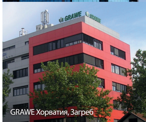
GRAWE Хорватия, Загреб