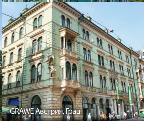
GRAWE Австрия, Грац