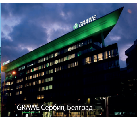
GRAWE Сербия, Белград