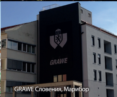
GRAWE Словения, Марибор