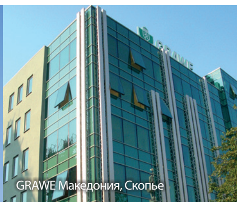
GRAWE Македония, Скопье