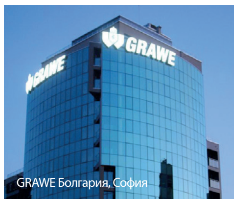
GRAWE Болгария, София

GRAWE nekretnine d.o.o. Beograd GRAWE nekretnine d.o.o. Banja Luka GRAWE Nedviznosti dooel Skopje GRAWE Imoti dooel Skopje GRAWE Imoti EOOD Sofia GRAWE Facility Management SRL BAYOU Kft. GRAWE Inqlatan Kft. GRAWE FM d.o.o. Sarajevo GRAWE nepremicnine d.o.o.